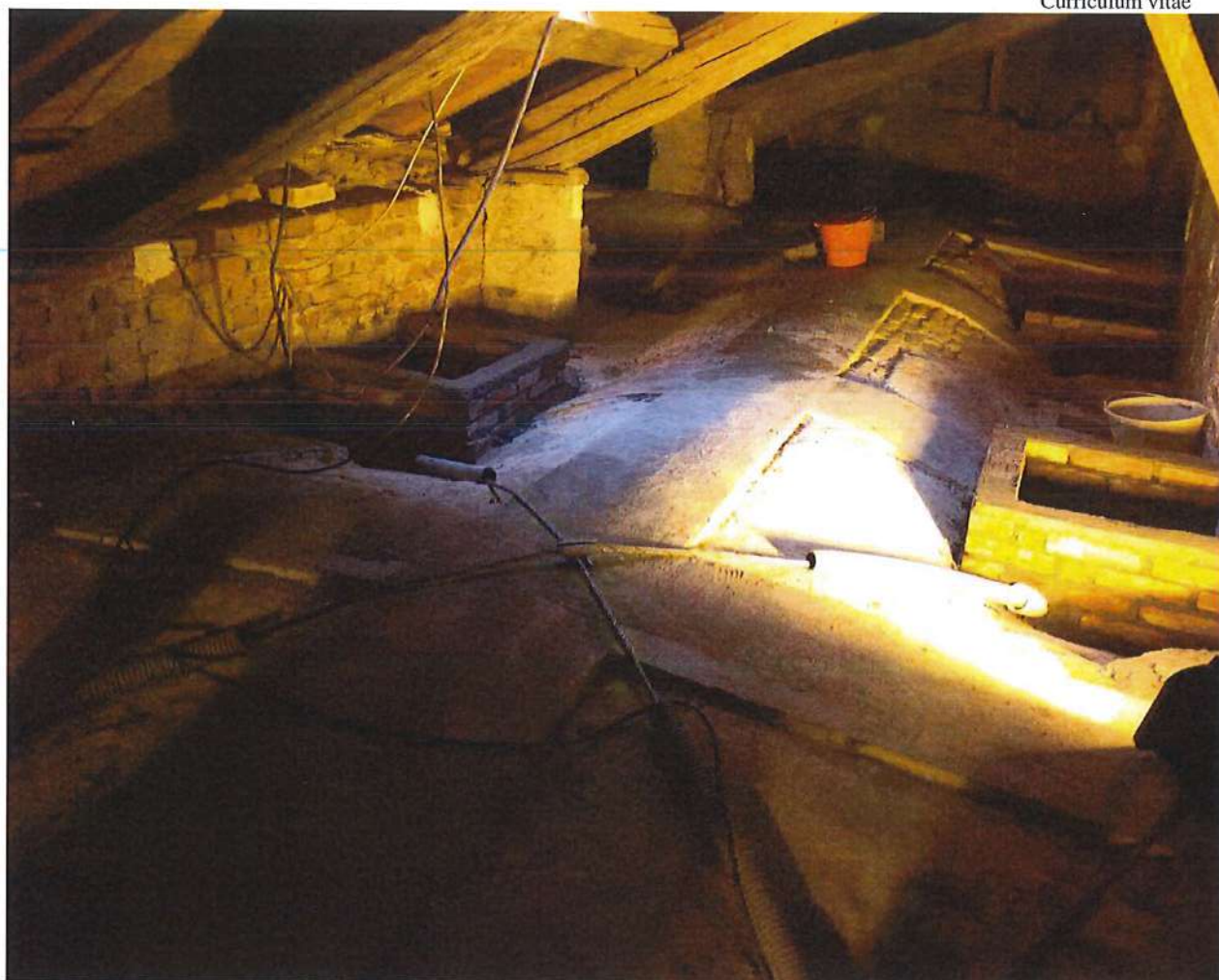
Foto n°2 – consolidamento estradossale delle volte a corciera con la tecnica del carbonio e dei cavi di compressione in armature a trefolo

Fase di preparazione del piano di applicazione del carbonio lungo le generatrici delle volte e di posa dei cavi in acciaio a trefolo continuo