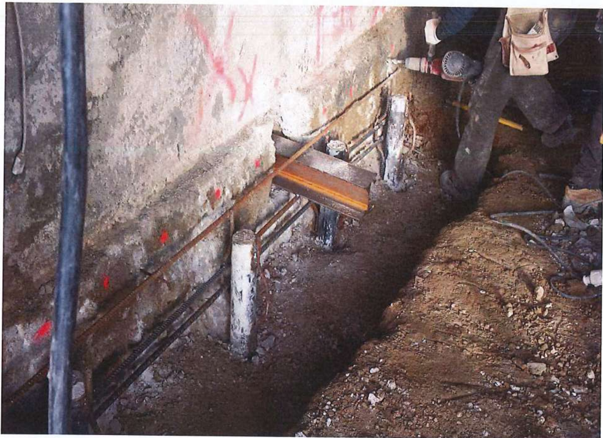
Foto n° 1 – Intervento di consolidamento delle fondazioni esistenti mediante fondazioni indirette micropali e putrelle a moncone