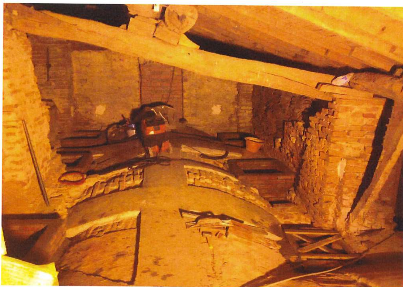
Foto n°1 – consolidamento estradossale delle volte a botte con la tecnica del carbonio

1. INTERVENTO DI CONSOLIDAMENTO STRUTTURALE E MIGLIORAMENTO SISMICO PARROCCHIA DI SAN ZENONE AL PO (PV)