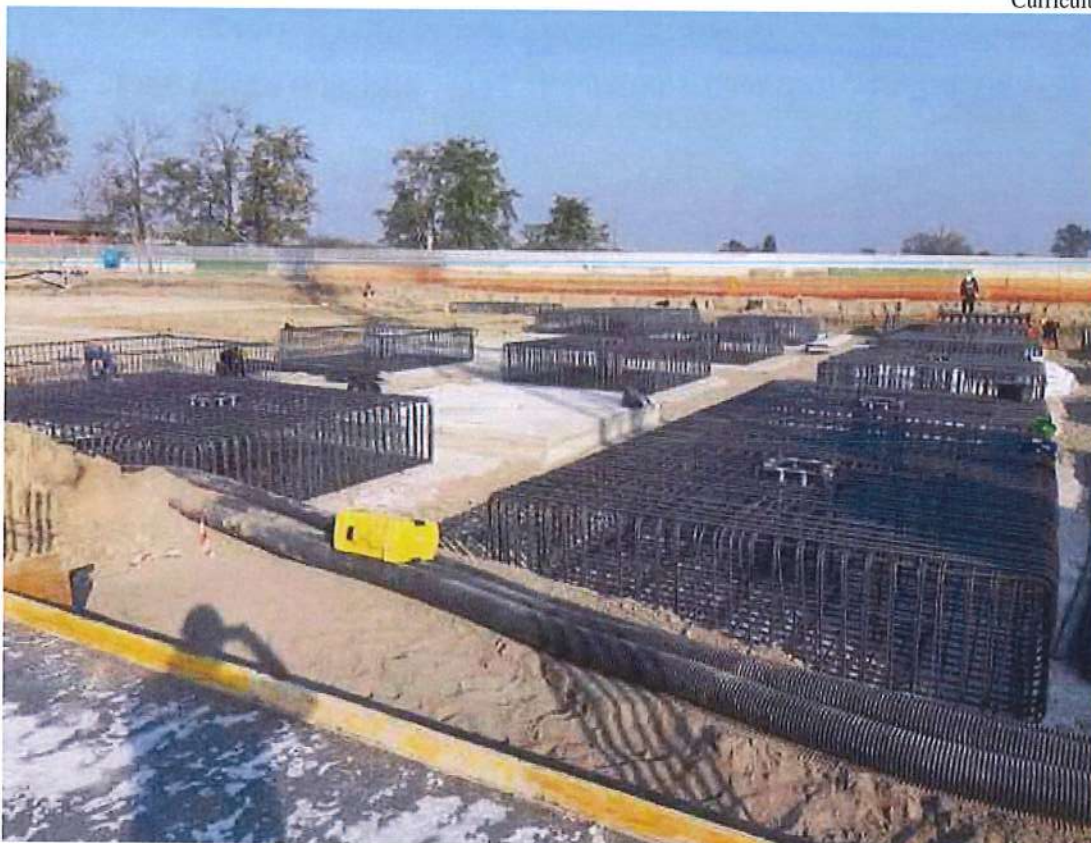
Foto n° 2 Opere strutturali di fondazione edificio Lotto n°1 – Cittadella dello Sport