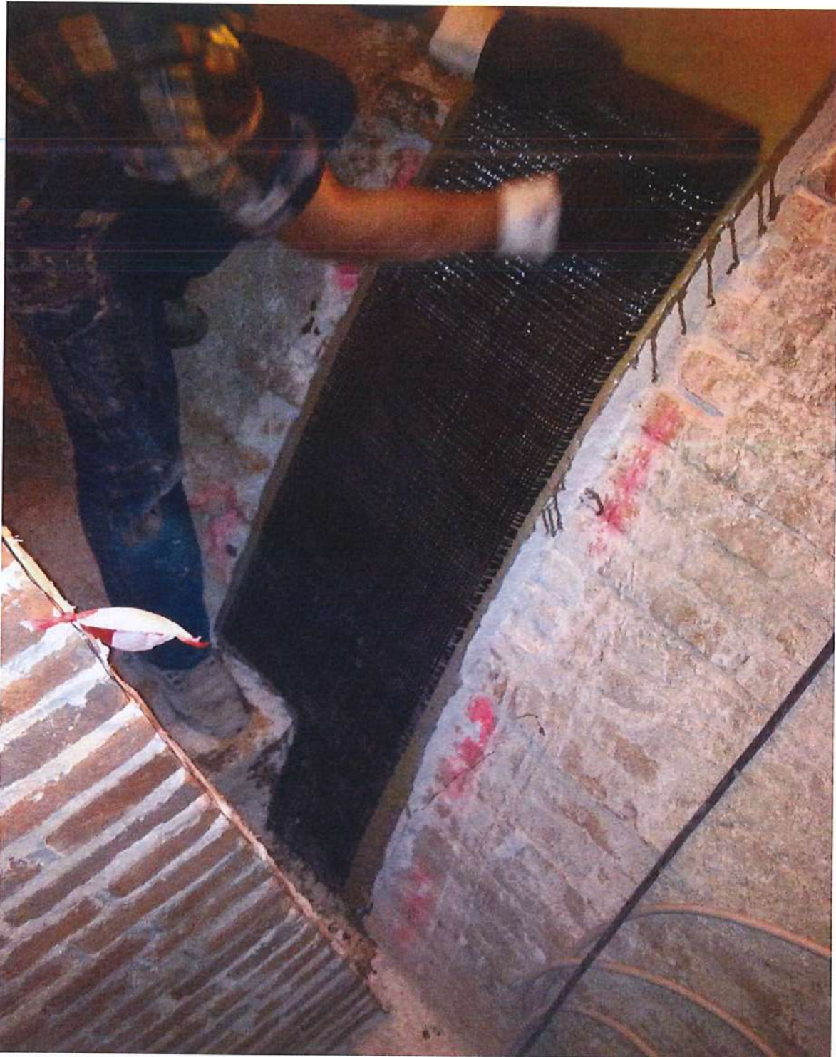
Foto n° 5 - consolidamento estradossale delle volte a corciera con la tecnica del carbonio, stesa delle matrici di carbonio di tipo bi-direzionale