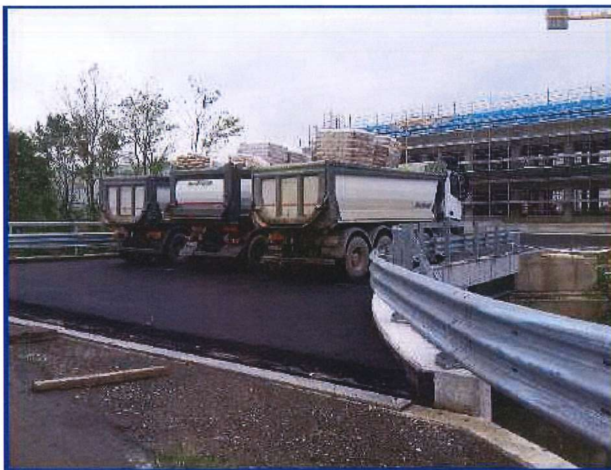
Foto n° 1 Ponte Roggia grande Bolognini Prova di carico per redazione del Collaudo statico

PONTE SULLA ROGGIA GRANDE BOLOGNINI PER RACCORDO STRADA PROVINCIALE S.P.412 (EXS.S.412) E STABILIMENTO DITTA UGOLINI – campata unica luce l=16,50 ml.