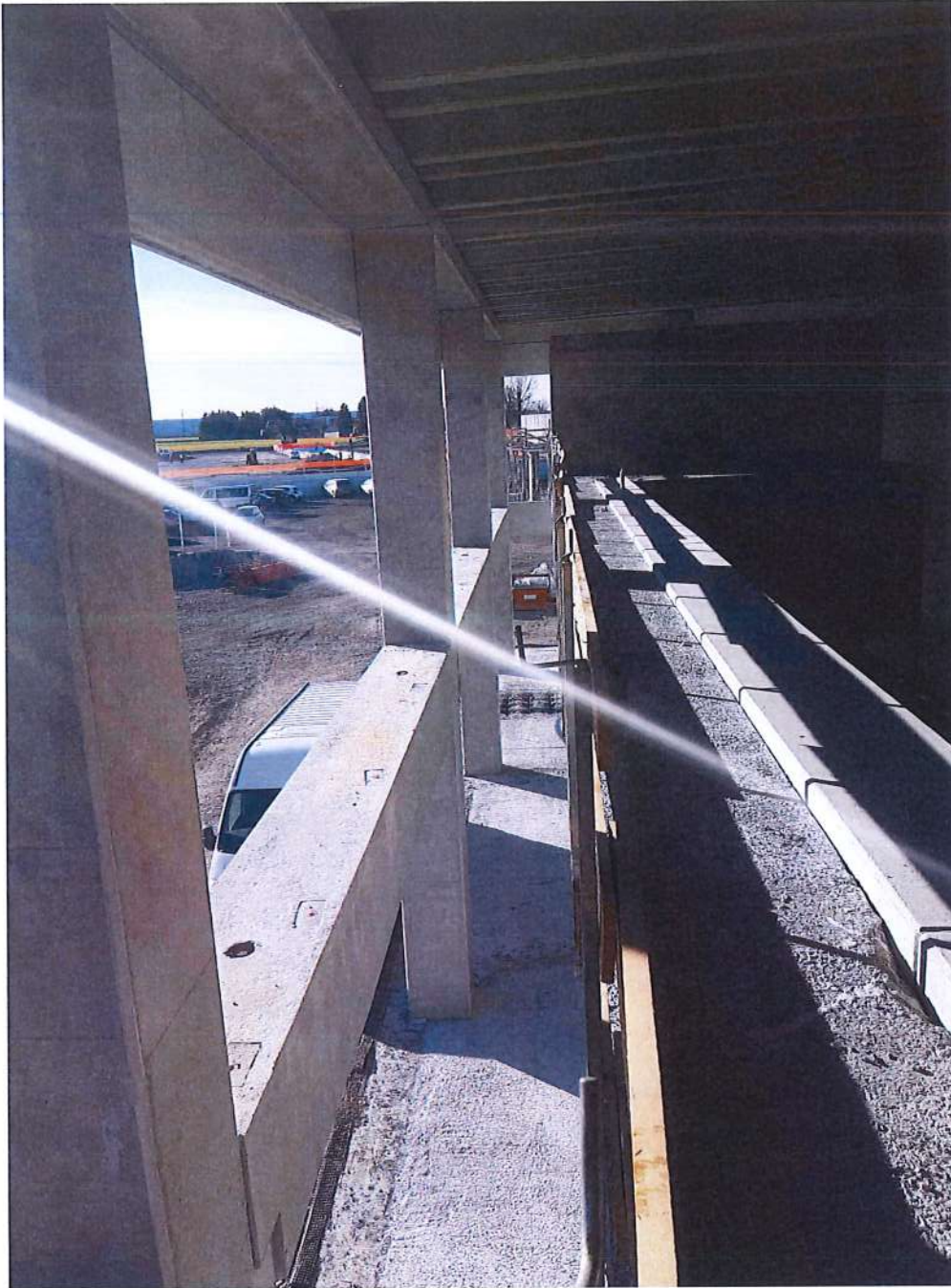
Foto n° 3 Opere strutturali edificio Lotto n°1 – Cittadella dello Sport