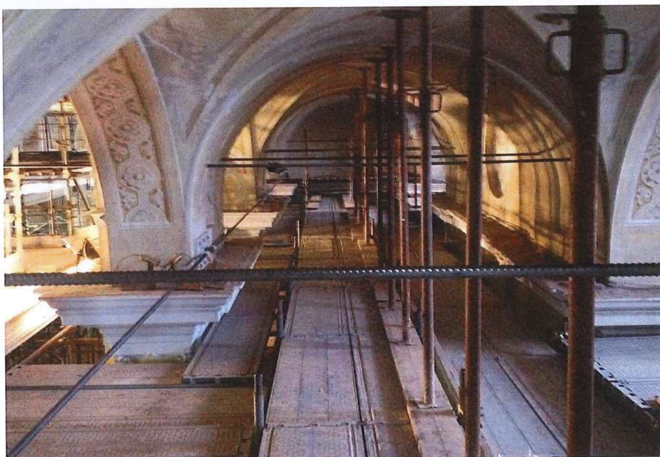
Foto n° 6 – n°7 Intervento di tirantatura con barre diwidag ad alta resistenza a trazione nelle zone intradossali delle volte a crociera - navate laterali