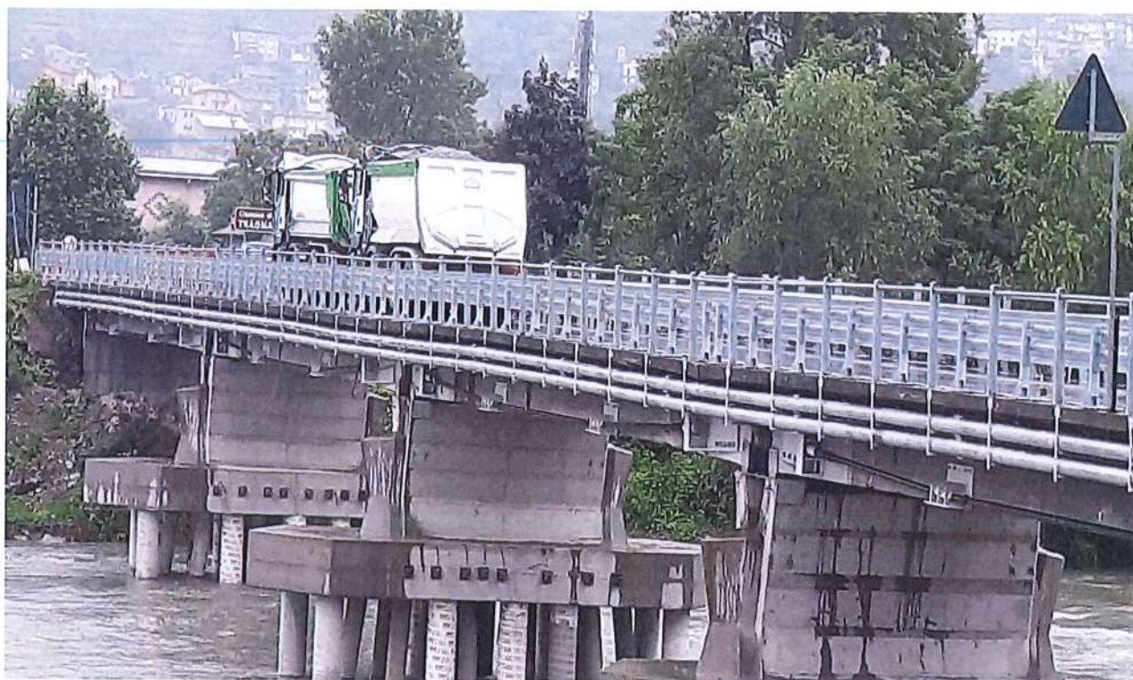
Foto n° 1 Ponte sul fiume Adda Prova di carico per redazione del Collaudo statico