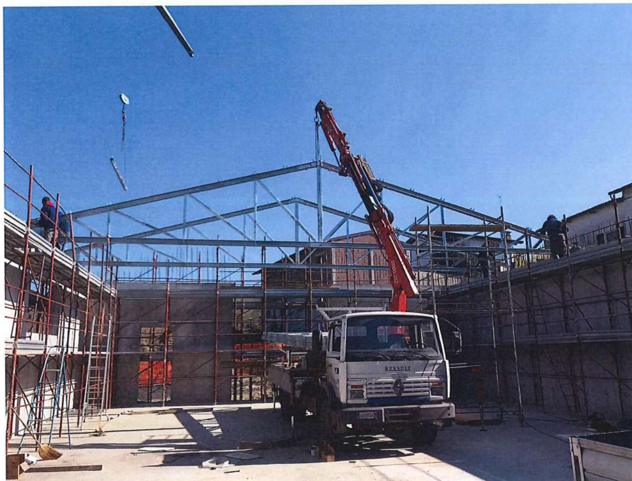
Foto n° 1 Montaggio in opera di capriata metallica avente luce L=16,00 mt

4. REALIZZAZIONE DI CAPANNONE AD USO COMMERCIALE/AGRICOLO CON COPERTURA IN ELEMENTI STRUTTURALI IN ACCIAIO – CAPRIATA METALLICA DI LUCE PARI A L= 16,00MT (PROGETTISTA E DIRETTORE DELLE OPERE STRUTTURALI IN CEMENTO ARMATO ED ACCIAIO).