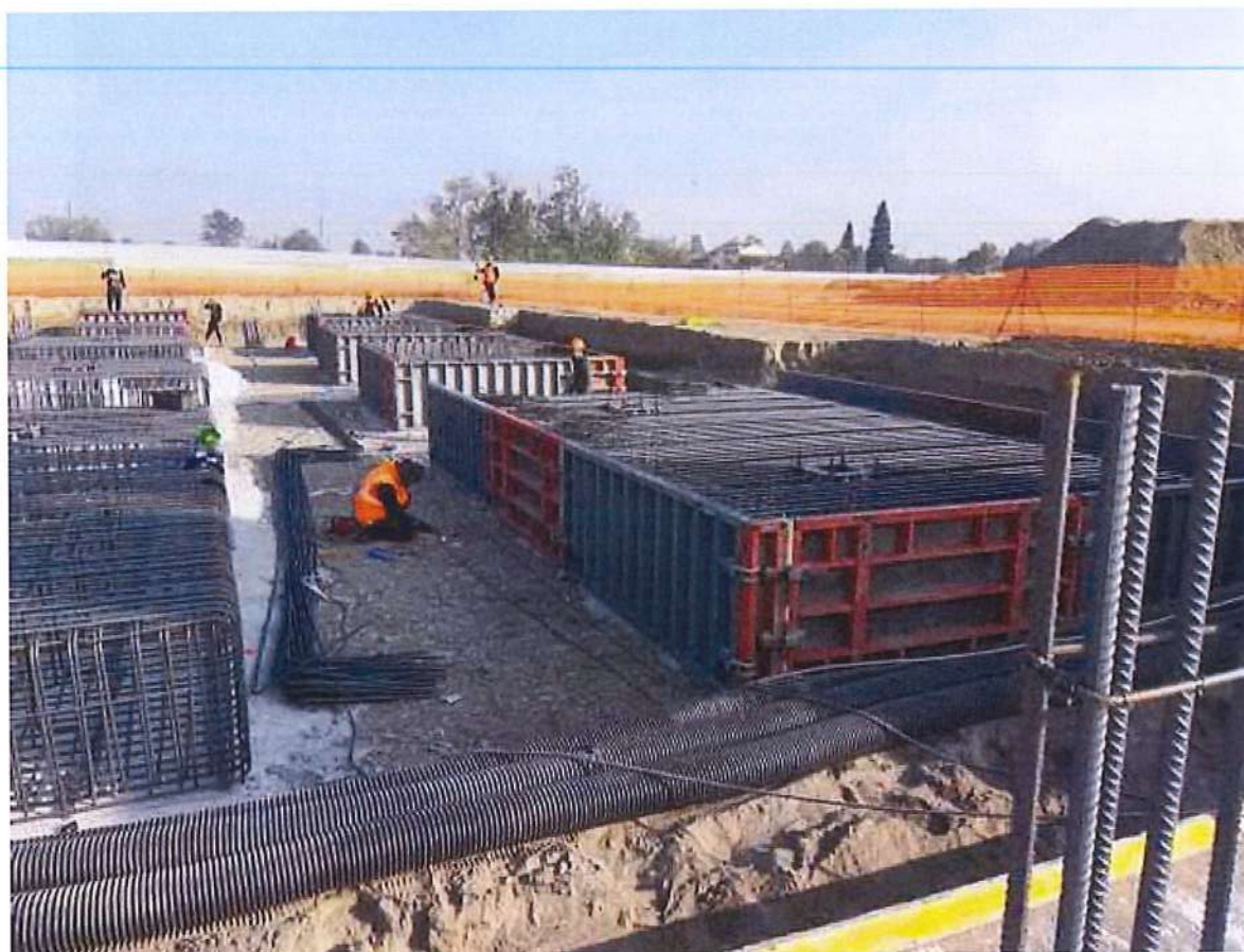
Foto n° 1 Opere strutturali di fondazione edificio Lotto n°1 – Cittadella dello Sport